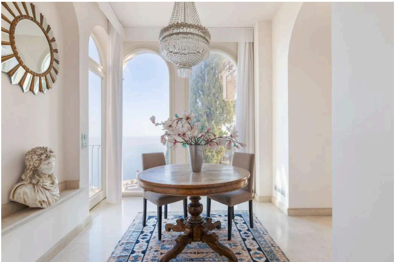
La villa dell'artista Corrado Cagli a Taormina, costruita a fine '800 è stata restaurata nell'ultimo decennio recuperando gli elementi d'epoca.

Una spettacolare villa a Taormina , la più ambita e ambiziosa. La dimora dell'artista Corrado Cagli è in vendita per 15 milioni di euro. Da questo angolo di paradiso, immerso tra il verde della vegetazione e il blu intenso del mare, sono passati alcuni tra i maggiori esponenti dell'élite culturale italiana del '900: dal poeta e scrittore Giuseppe Ungaretti , a Pier Paolo Pasolini , dal direttore d'orchestra Riccardo Muti fino agli scrittori Alfonso Gatto ed Elio Vittorini. Personaggi illustri, ospiti di ricevimenti in stile Dolce Vita , tra gli anni '50 e '60 , quando Taormina era al massimo del suo splendore ed era tra le mete preferite di attori famosi, artisti e capi di stato che presenziavano ad eventi, feste esclusive ed iniziative mondane. Oggi quella stessa dimora, appartenuta al noto artista Corrado Cagli , amato particolarmente da Pasolini, è stata messa in vendita, con un prezzo di partenza di 15 milioni di euro e mandato esclusivo affidato alla società Building Heritage - Forbes Global Properties. «Si tratta di una villa davvero unica nel suo genere, nei cui ambienti si respira tutta l'atmosfera dell'élite culturale italiana del '900 poiché questa dimora, oltre a vedere la nascita delle opere di Cagli, che fanno parte delle collezioni artistiche di musei e fondazioni pubbliche e private in tutto il mondo, ospitò anche numerosi intellettuali dell'epoca e dei giorni nostri», afferma Cinzia Romanelli, ceo di Building Heritage - Forbes Global Properties.