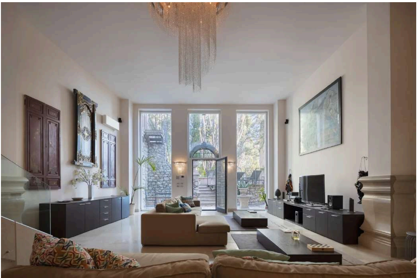
Il sontuoso living di Villa Cagli, casa in vendita a Taormina che fu del celebre artista romano.

In questa villa a Taormina la bellezza sta negli interni come negli esterni, il parco di proprietà, di oltre mille metri quadrati, vanta piante secolari e mediterranee con terrazzamenti d'epoca che conducono ad un'altra dépendance adiacente alla villa, che si presenta come un ulteriore appartamento completo di zona notte, living e cucina. Ed è proprio nel giardino che si trova anche quello che un tempo fu l'atelier dall'artista Cagli, trasformato oggi in uno splendido loft caratterizzato da grande zona living con camino, zona dining, cucina, servizi e, al piano superiore, due camere da letto con rispettivo bagno. Non poteva mancare il comfort e il lusso di una piscina a sfioro , con zona idromassaggio.