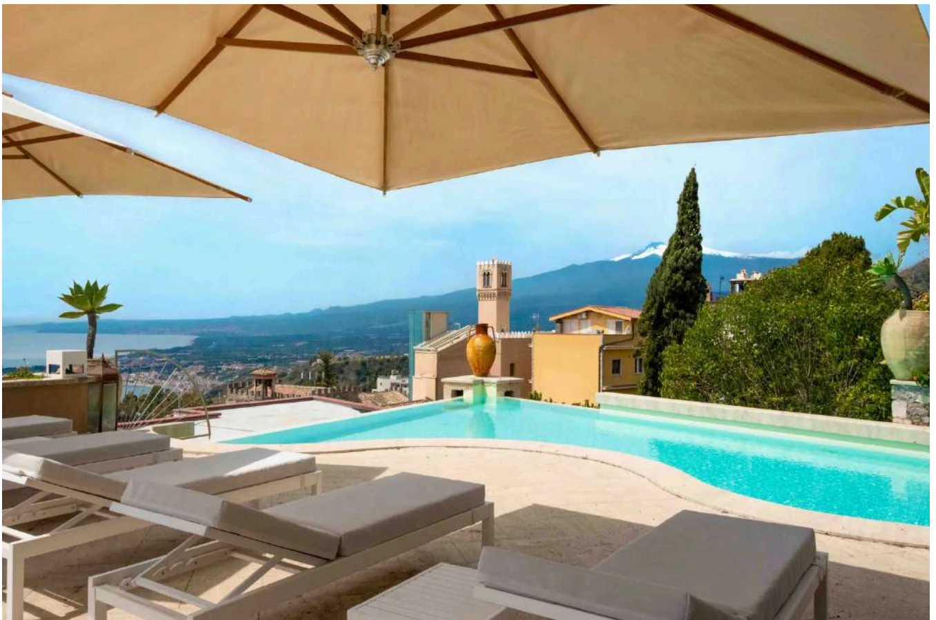
La spettacolare piscina a sfioro co vista mozzafiato sul golfo di Taormina, la villa comprende anche un idromassaggio outdoor.

Villa Cagli è senza dubbio una delle più suggestive dimore della zona. Costruita sulla roccia, spicca sul punto più alto della città con una vista panoramica a 360° sul golfo. Questa villa a Taormina venne costruita a fine '800, negli ultimi anni è stata oggetto di un restauro premuroso e filologico che l'ha riportata agli antichi splendori, con il recupero delle parti storiche originali. Si sviluppa su 3 livelli con una superficie complessiva di oltre 1000 metri quadrati con altrettanto spazio di parco , con piscina e parcheggio privato. Il tutto magnificamente affacciato sul mare. Dall'ingresso al piano terra si accede alla zona living con grande vetrata sul mare e un camino monumentale d'epoca. Accanto si trovano lo studio, un'area dining con una grande vetrata panoramica, e un'ampia cucina. Una scala conduce al piano superiore che ospita la zona notte con camere, bagni, studio e ulteriori panoramici terrazzi. Il livello sottostante è una sorta di dépendance autonoma, organizzata con due ulteriori camere da letto con rispettivo bagno en suite, una seconda cucina, una zona living sempre con vista mare e sul parco di proprietà.