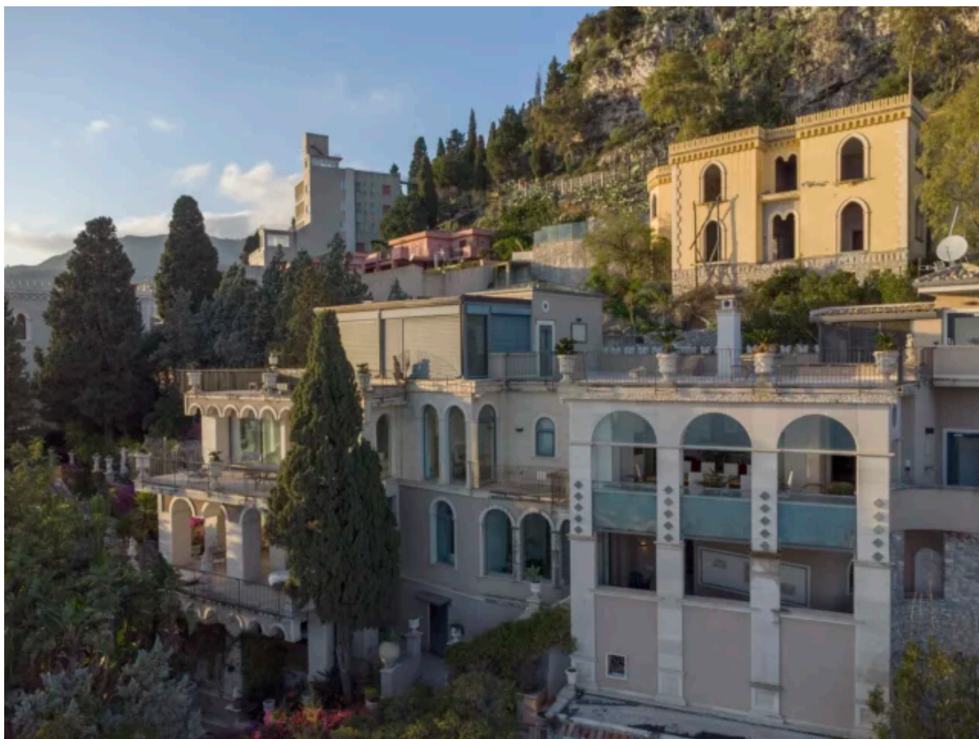
La dimora a Taormina

La sua opera è caratterizzata da una continua sperimentazione e da una grande varietà di temi e tecniche.