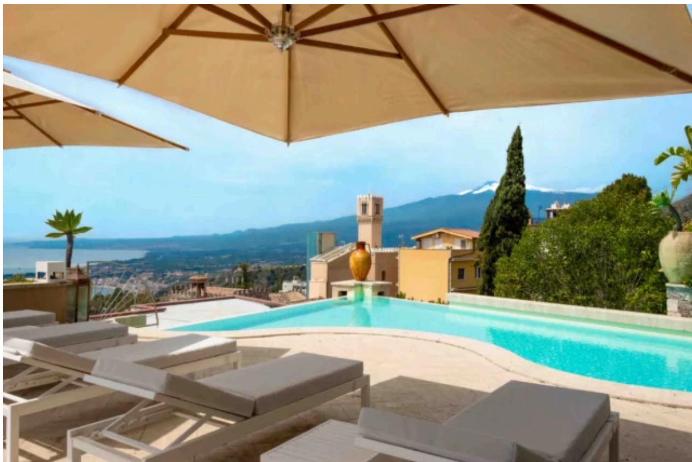
La piscina con vista di Villa Cagli a Taormina

In vendita per 15 milioni di euro Villa Cagli a Taormina un angolo di paradiso che ospitò l'Elite culturale della dolce vita. Infatti, Giuseppe Ungaretti , Pier Paolo Pasolini , ma anche il direttore d'orchestra Riccardo Muti e gli scrittori Alfonso Gatto ed Elio Vittorini sono stati gli ospiti illustri di questa dimora storica. La villa si sviluppa su 3 livelli esposti sul mare per oltre 1000 mq, con altrettanti 1000 mq di parco, terrazzamenti, piscina e parcheggio privato.