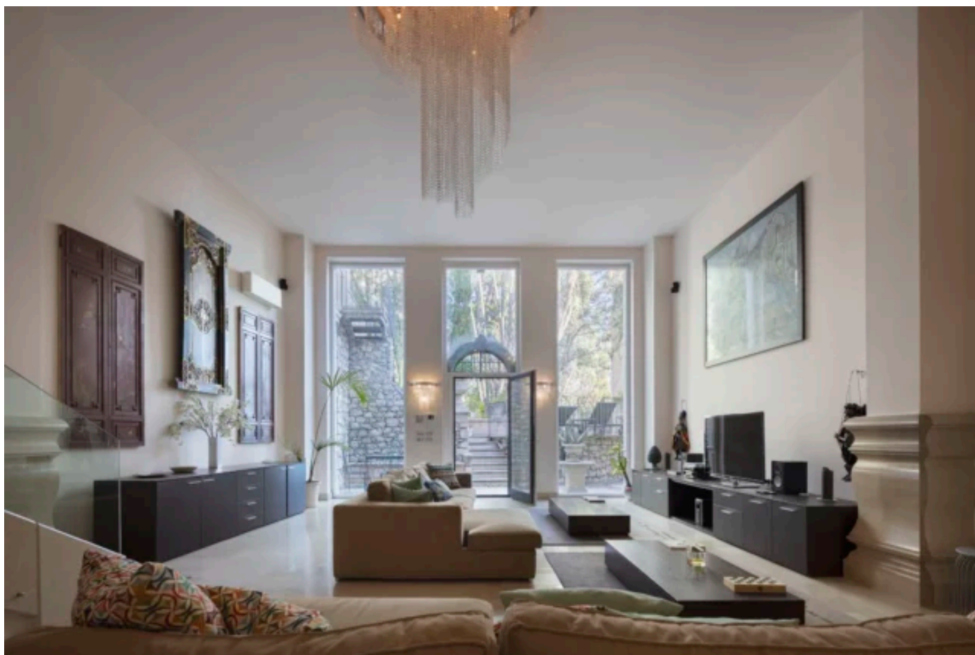
Vista sul parco dall'interno di Villa Cagli a Taormina