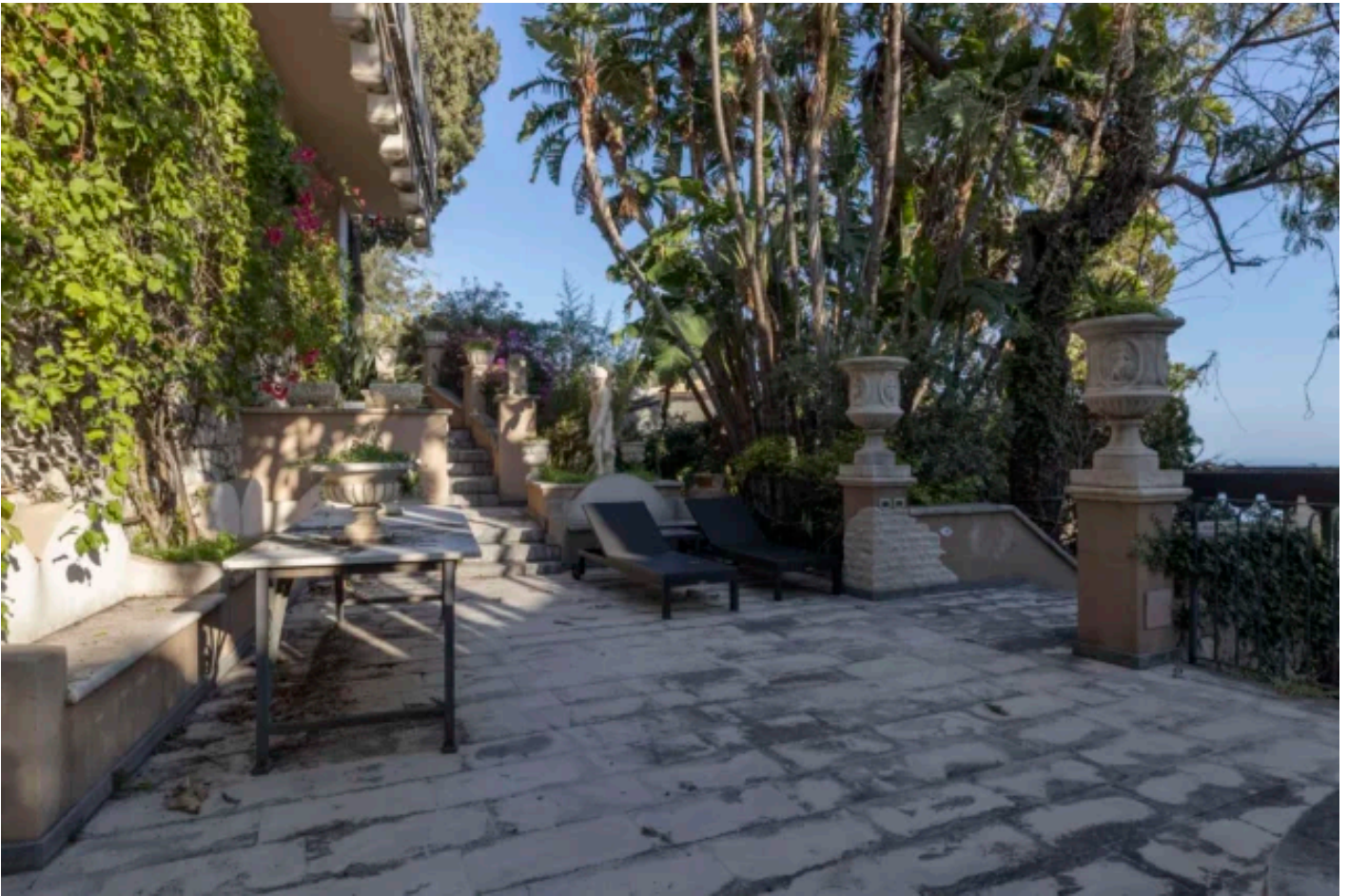
Scorcio del Parco di Villa Cagli a Taormina